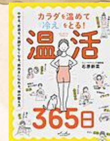
『カラダを温めて冷えを とる! 温活365日』 石原 新菜/著