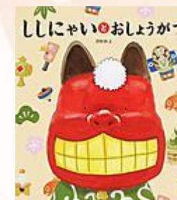
『ししにゃいと おしょうがつ』 澤野 秋文/作