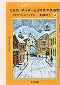
『ミセス・ポッターと クリスマスの町 上・下巻』 ラウラ・フェルナンデス/著 宮崎 真紀/訳