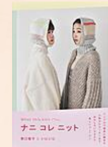
『ナニコレニット』 野口 智子/著 いにいに/著