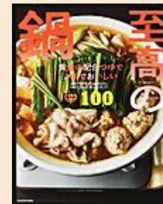
『至高の鍋』 リュウジ/著