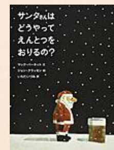
『サンタはどうやって えんとつをおりるの?』 マック・バーネット/文 ジョン・クラッセン/絵 いちだ いづみ/訳