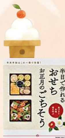
『半日で作れるおせち お正月のごちそう』 オレンジページ/出版