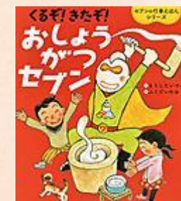
『くるぞ!きたぞ! おしょうがつセブン』 もとした いづみ/作 くだ いわお/絵