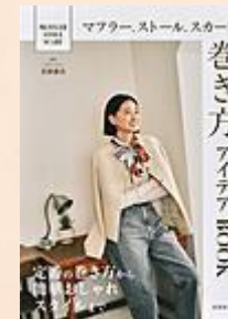
『マフラー、ストール、 スカーフ巻き方アイデア BOOK』 若狹 恵美/監修