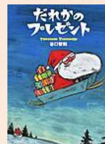
『だれかのプレゼント』 谷口 智則/著