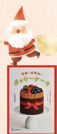
『素敵に超簡単! ボッキーケーキ』 江崎 美恵子/著