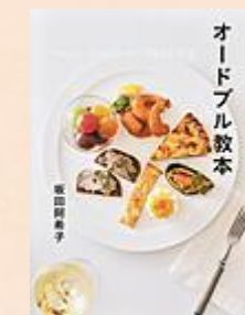
『オードブル教本』 坂田 阿希子/著