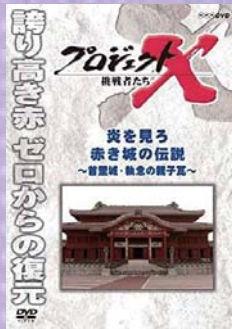
プロジェクトX 炎を見る赤き城の伝説 NHK/フットウェア

2019年10月31日、火災により首里城正殿を含む建物8棟が焼失しました。首里城正殿などは戦前に国宝に指定され、戦争で失われました。現在の建物は1992年に復元され、2000年12月に日本で11番目の世界遺産に登録されました。焼失した首里城の再建に向け、2022年から本格的な工事に入り、2026年中に完成を目指す計画です。