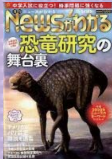
月刊NEWSがわかる 20年1月号 毎日新聞社