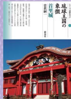
琉球王国の象徴 首里城 宮眞 嗣一 著