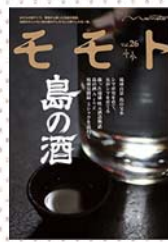
『モモト Vol.26 島の酒』