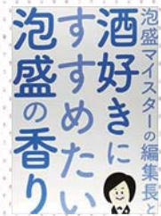
『泡盛マイスターの編集長と酒好きにすすめたい泡盛の香り』