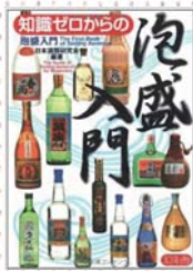
『知識ゼロからの泡盛入門 The First Book of Tasting Awamori』

沖縄へは600年前(15世紀)の琉球王朝時代に中国やシャム(タイ)、東南アジアとの交易の中で琉球泡盛は誕生しました。第二次世界大戦で100年を超える古酒はほとんど失われてしまいましたが、大切に管理していけば、各ご家庭でも100年、200年の古酒を育てることができます。